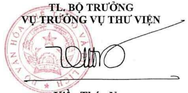
Kiều Thúy Nga