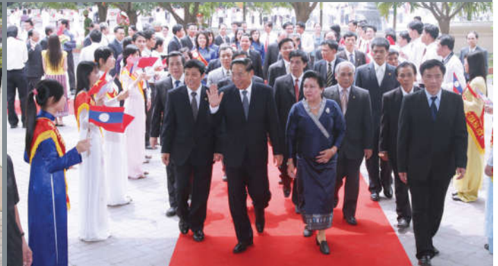
Đồng chí Chum-ma-ly Xay-nhạ-xôn, Tổng Bí thư Đảng NDCM Lào, Chủ tịch nước CHDCND Lào thăm ĐHQGHN, năm 2011.