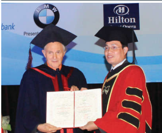
GS. Harold W. Kroto (Giải Nobel Hóa học năm 1996) nhận bằng Tiến sĩ danh dự của ĐHQGHN.

ĐHQGHN không những thực hiện thành công vai trò nòng cốt của mình ở trong nước mà còn góp phần nâng cao vị thế của đại học Việt Nam trên trường quốc tế. ĐHQGHN là điểm đến của nhiều nguyên thủ, chính khách, học giả uy tín và nổi tiếng trên thế giới, trong số đó nhiều người đã được nhận bằng Tiến sĩ danh dự của ĐHQGHN.