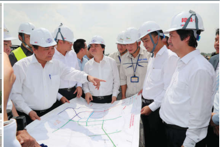
Thủ tướng Nguyễn Xuân Phúc thăm dự án xây dựng ĐHQGHN tại Hòa Lạc, năm 2017.