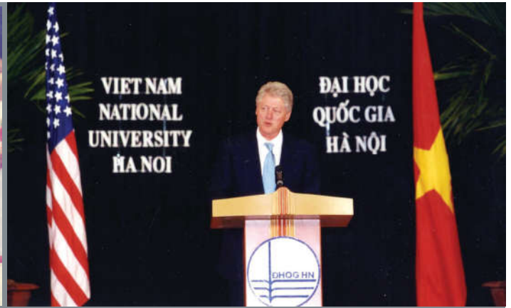
Tổng thống Hợp chúng quốc Hoa Kỳ Bill Clinton phát biểu tại ĐHQGHN năm 2000.