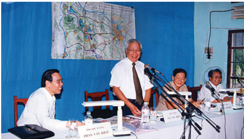
Thủ tướng Võ Văn Kiệt và các Phó Thủ tướng Nguyễn Khánh, Phan Văn Khải và Trần Đức Lương tại buổi làm việc về quy hoạch ĐHQGHN và các vùng phụ cận, năm 1994.

Ngày 10/12/1993, Thủ tướng Chính phủ ký Nghị định số 97/CP thành lập ĐHQGHN trên cơ sở tổ chức, sắp xếp lại 3 trường đại học lớn ở Hà Nội: Trường ĐH Tổng hợp Hà Nội, Trường ĐH Sư phạm Hà Nội I và Trường ĐH Sư phạm Ngoại ngữ Hà Nội.