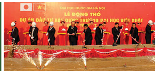
Chủ tịch nước Trương Tấn Sang dự Lễ động thổ dự án đầu tư xây dựng Trường ĐH Việt Nhật tại Hòa Lạc, năm 2014.

Những mong muốn, trăn trở của ông được các thế hệ sau này không ngừng nỗ lực, cố gắng để sớm hiện thực hóa. Sau 25 năm, khuôn viên của một khu đô thị đại học hiện đại mang tầm khu vực và quốc tế đã và đang hình thành tại Hòa Lạc.