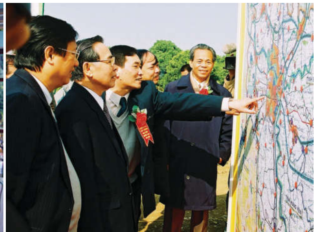
Thủ tướng Phan Văn Khải dự Lễ phát động khởi công xây dựng ĐHQGHN tại Hòa Lạc năm 2003.

Trong nhiều năm, cố Thủ tướng Võ Văn Kiệt luôn trăn trở: "Với quy mô của một Đại học Quốc gia thì điều kiện cơ sở vật chất còn quá khiêm tốn, hoàn toàn chưa đủ. Lẽ ra chúng ta phải đầu tư xây dựng ĐHQGHN ở Hoà Lạc sớm hơn. Nếu trong vòng 10 năm tới, chúng ta có thể xây dựng hoàn thiện ĐHQGHN trên diện tích đã được quy hoạch ở Hoà Lạc thì rất tốt. Điều đó mới xứng với tầm cỡ, đúng với ý nghĩa của ĐHQGHN, một trung tâm đào tạo, nghiên cứu khoa học lớn của Thủ đô và cả nước".