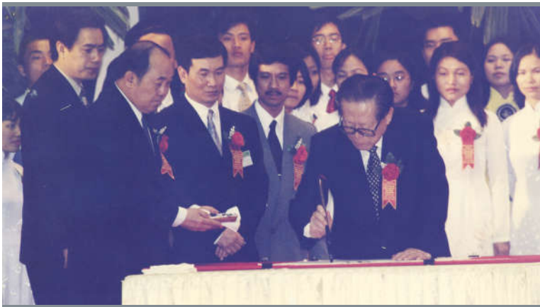
Đồng chí Tổng Bí thư, Chủ tịch nước CHND Trung Hoa Giang Trạch Dân viết thư pháp tặng cán bộ và sinh viên ĐHQGHN trong lần về thăm năm 2002.