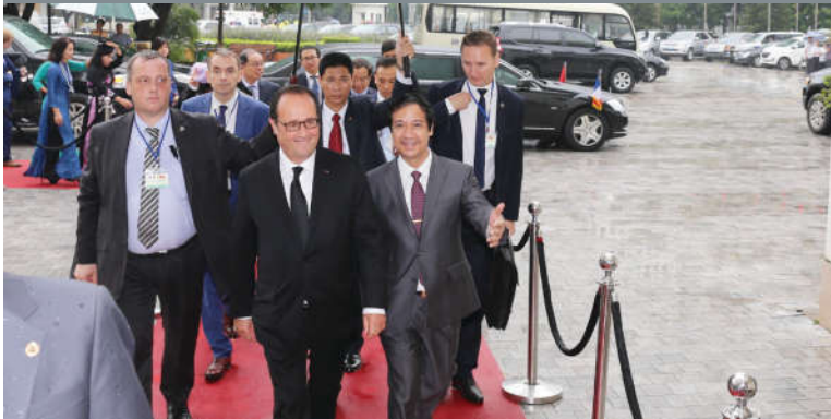
Tổng thống Cộng hòa Pháp Francois Hollande thăm ĐHQGHN và phát biểu về tương lai chung của Pháp - Việt Nam năm 2016.