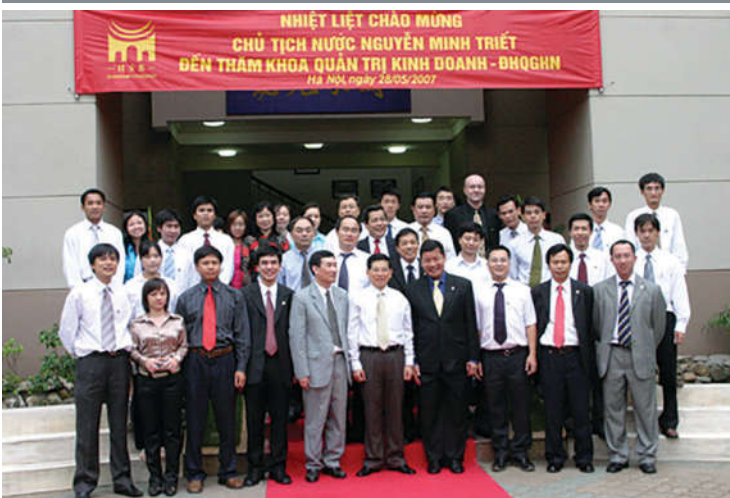
Chủ tịch nước Nguyễn Minh Triết thăm và làm việc tại ĐHQGHN, năm 2007.