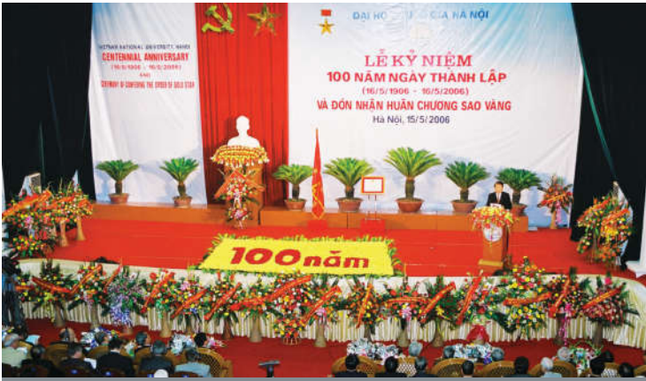
Lễ kỉ niệm 100 năm ngày thành lập ĐHQGHN và đón nhận Huân chương Sao Vàng, năm 2006.