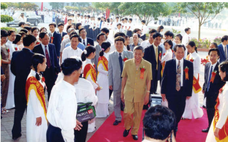
Tổng Bí thư Lê Khả Phiêu thăm và làm việc với ĐHQGHN, năm 2000.