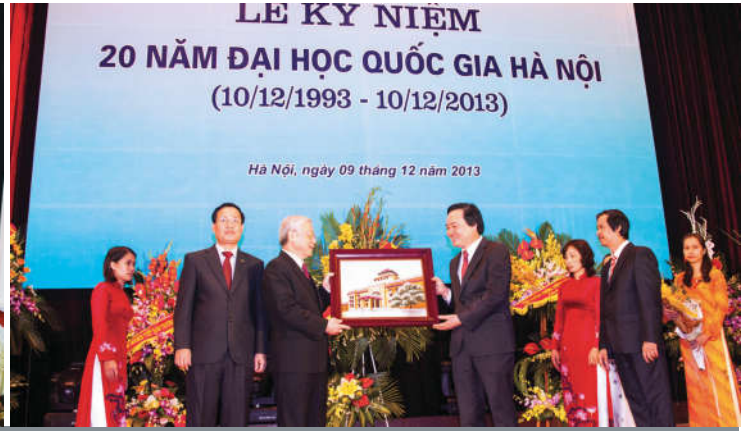
Tổng Bí thư Nguyễn Phú Trọng dự Lễ kỉ niệm 20 năm ngày Chính phủ ban hành Nghị định về ĐHQGHN, năm 2013.