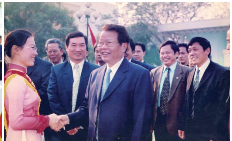
Chủ tịch nước Trần Đức Lương thăm và làm việc với ĐHQGHN, năm 2004.