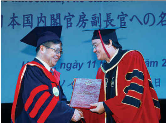
Ông Seko Hiroshige - Phó Chánh Văn phòng Nội các Nhật Bản nhận bằng Tiến sĩ danh dự của ĐHQGHN.

ĐHQGHN không những thực hiện thành công vai trò nòng cốt của mình ở trong nước mà còn góp phần nâng cao vị thế của đại học Việt Nam trên trường quốc tế. ĐHQGHN là điểm đến của nhiều nguyên thủ, chính khách, học giả uy tín và nổi tiếng trên thế giới, trong số đó nhiều người đã được nhận bằng Tiến sĩ danh dự của ĐHQGHN.