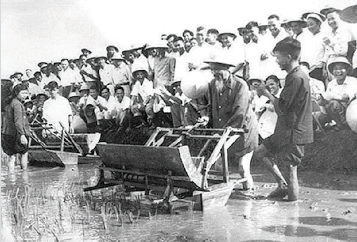
Chủ tịch Hồ Chí Minh dùng thử máy cấy lúa cải tiến tại Trại thí nghiệm trồng lúa Sở Nông lâm Hà Nội, tháng 7/1960.

sâu xa hơn nữa. Đối với chúng ta nó là một ngày để cho thế giới biết rằng: Ngày này chẳng những là ngày Tết Lao động, mà cũng là ngày nhân dân đoàn kết. Đoàn kết để giữ vững tự do dân chủ. Đoàn kết để kiến thiết nước nhà. Đoàn kết để xây dựng một đời sống mới”.