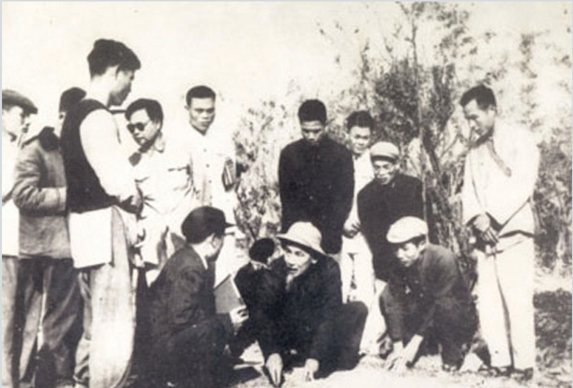
Chủ tịch Hồ Chí Minh nói chuyện quy hoạch đất nông nghiệp.

truyền đơn ở các đường phố, chợ búa, công sở. Nhiều cuộc mít-tinh biểu tình, bãi công, tuần hành thị uy được tiến hành ở nhiều nơi.