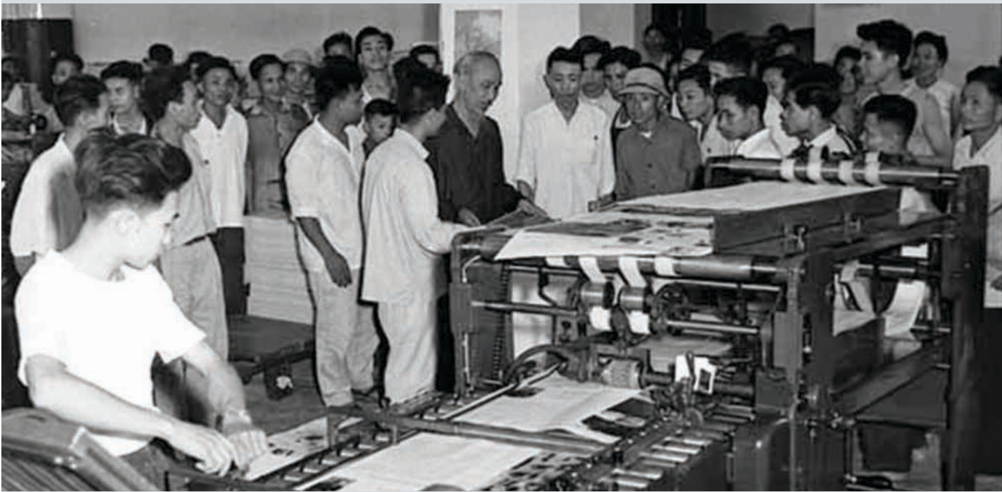
Chủ tịch Hồ Chí Minh thăm Nhà máy in Tiến Bộ, 14/5/1959