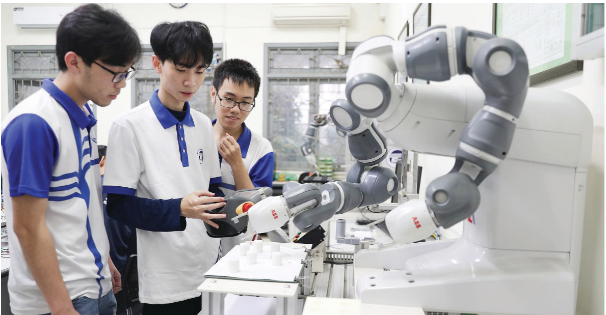
Sinh viên ĐHQGHN tích cực tham gia nghiên cứu khoa học.

Đại hội lần thứ nhất của Đảng bộ ĐHQGHN chủ trương ban đầu thành lập các khoa trực thuộc ĐHQGHN về các lĩnh vực mới, từng bước phát triển và đến khi đủ điều kiện thì nâng cấp thành các trường thành viên. Một loạt các khoa trực thuộc đã ra đời sau đó như: Khoa Công nghệ (nay là Trường ĐH Công nghệ) được thành lập trên cơ sở Khoa Công nghệ thông tin và Khoa Điện tử Viễn thông của Trường ĐH Khoa học Tự nhiên; Khoa Kinh tế (nay là Trường ĐH Kinh tế) và Khoa Luật (nay là Trường ĐH Luật) phát