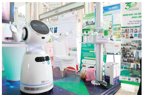
Một số sản phẩm KH&CN của các nhà khoa học ĐHQGHN.

Thực tiễn cho thấy, mô hình ĐHQG đã phát huy hiệu quả trong suốt thời gian qua và đặc biệt thể hiện rõ rệt vai trò nòng cốt khi nền giáo dục nước ta nói chung, giáo dục đại học nói riêng gặp những khó