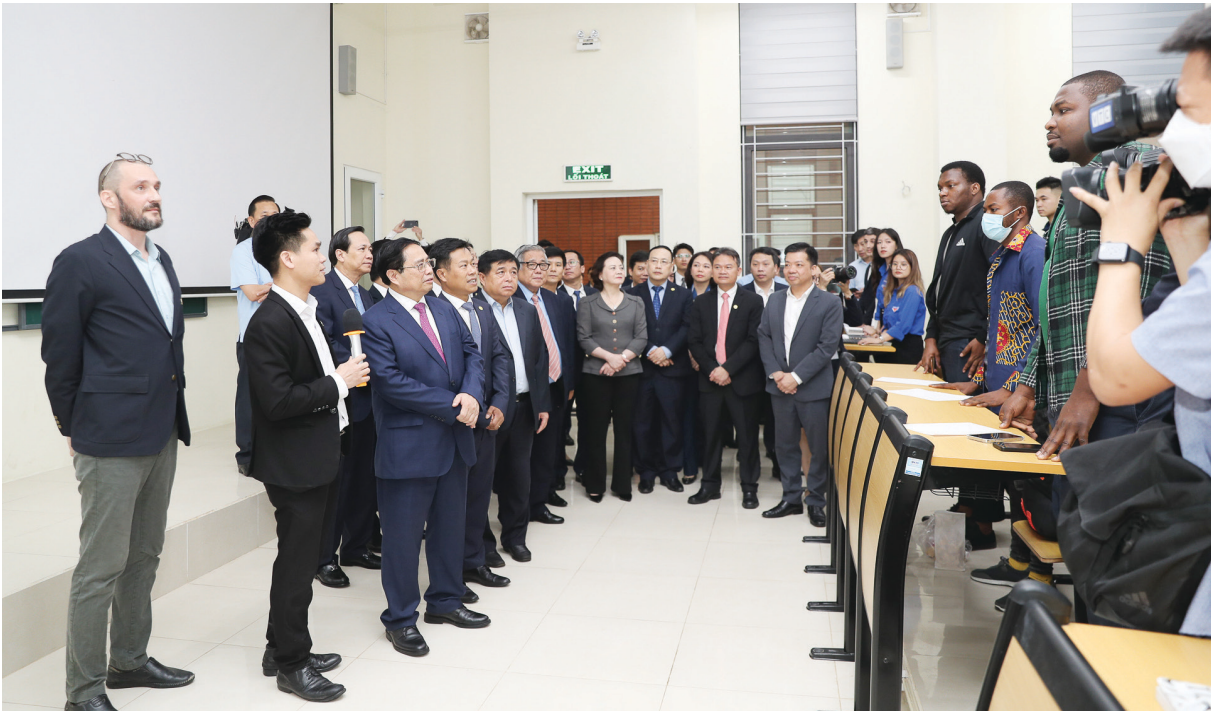
Thủ tướng Chính phủ Phạm Minh Chính cùng các lãnh đạo bộ, ngành trò chuyện với các sinh viên quốc tế học tập tại ĐHQGHN.

triển từ Khoa Kinh tế Chính trị và Khoa Luật của Trường ĐH Khoa học Xã hội và Nhân văn; Khoa Sư phạm (nay là Trường ĐH Giáo dục) được xây dựng hoàn toàn mới... Thế mạnh vẫn được xác định là các ngành khoa học cơ bản, còn những lĩnh vực khác thì không phát triển toàn diện, dần trải mà chỉ lựa chọn phát triển những hướng hiện đại, mũi nhọn nhất.